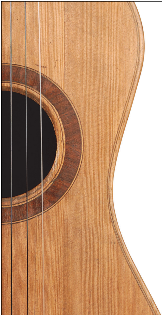
Gitarre Jacob August Otto, Weimar 1796