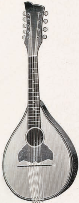
Nr. 1166/1 Thüringer Modell