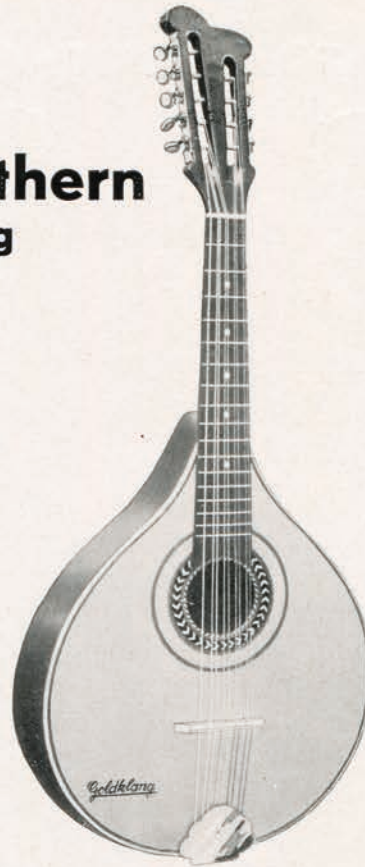
Nr. 1171/3 Hamburger Modell, mit Ebergher Kopf, Glassteg, flacher Boden