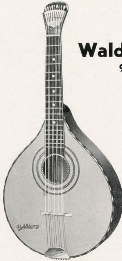
Nr. 1168/2 Hamburger Modell, mit Fächermechanik und Glassteg