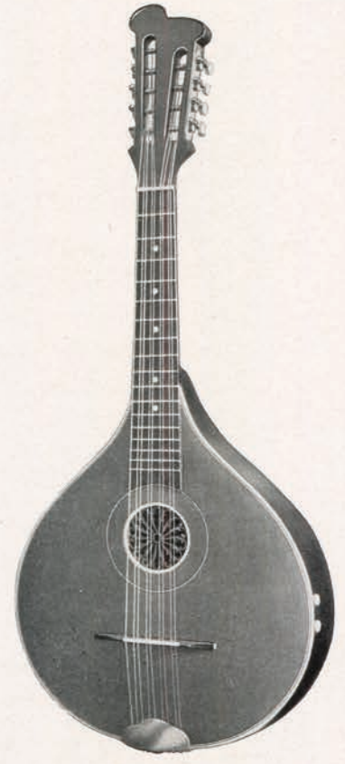
Nr. 1170/2 Großes Hamburger Modell, mit gewölbtem mehreiligen Boden, Ebergher Kopf