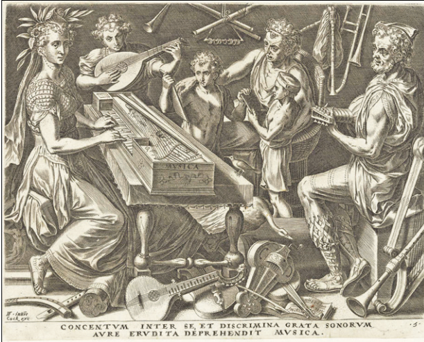
Cornelis Cort nach Frans Floris I.: Musica (Detail), fünftes Blatt aus: Die sieben freien Künste, Kupferstich, 1565, 22,8 x 28,3 cm (Platte); 22,9 x 28,4 cm (Blatt), unten links signiert: »FF - invent Cock exc«, rechts »5«