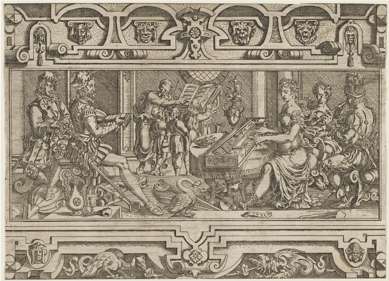
Jost Amman: Die Musik, aus: Die sieben freien Künste, Radierung, 1577, 16,0 x 22,1 cm, in der Platte invertiert signiert: »1577 JA«